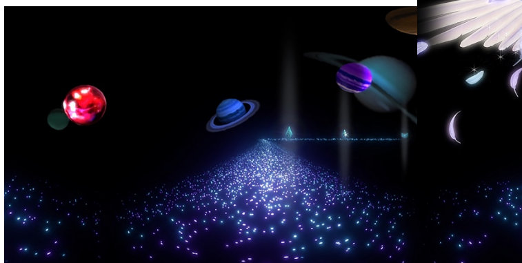
コンテンツ映像イメージ1